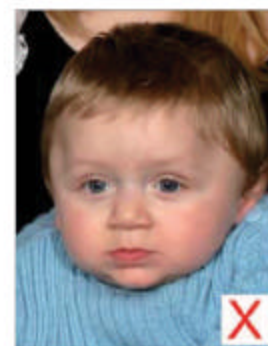
Autre personne présente

La photo doit représenter le sujet seul, sans dossier de fauteuil ou jouet visible par exemple. Le sujet doit regarder l'objectif en adoptant une expression neutre, bouche fermée.