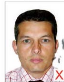
Traces / Pliures