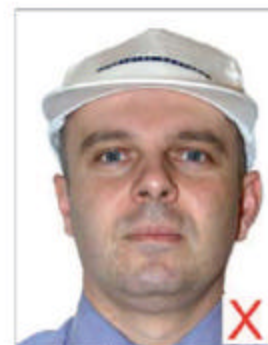
Port de casquette