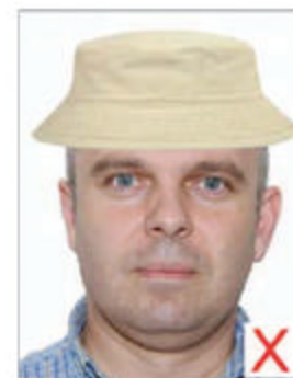
Port de chapeau